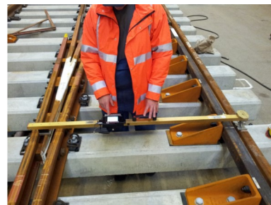
Vermessung von Weichen