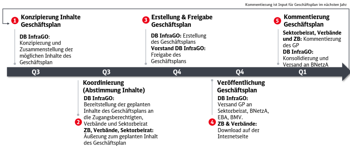
Abbildung 3 "Initialprozess zur Koordinierung des Geschäftsplans 2025"

Ab Bereitstellung des Geschäftsplan haben die Zugangsberechtigten sowie der Sektorbeirat und die Branchenverbände vier Wochen zur Kommentierung des Geschäftsplans. Im Anschluss werden die Rückmeldungen konsolidiert und für die Koordination und Erarbeitung des darauffolgenden Geschäftsplans genutzt. Zudem wird eine konsolidierte Übersicht der BNetzA zur Verfügung gestellt.