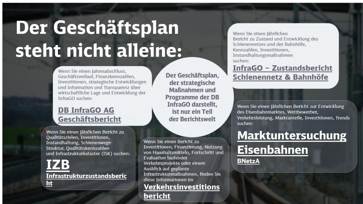
Abbildung 1 "Einordnung Geschäftsplan zu ausgewählten Berichten"

Bestehende Prozesse, Publikationen oder andere rechtliche Anforderungen bleiben hiervon unberührt (siehe Abbildung 1). Der Geschäftsplan ersetzt somit keine bestehenden Formate oder operativen Prozesse, sondern fokussiert sich auf die strategischen Maßnahmen und Programme der DB InfraGO zur Weiterentwicklung der bundeseigenen Eisenbahninfrastruktur in Deutschland sowie den übrigen in § 9 Abs. 2 ERegG genannten Themen.